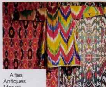
Alfies Antiques Market, Maison Assouline, Le Bamford Wellness Spa.